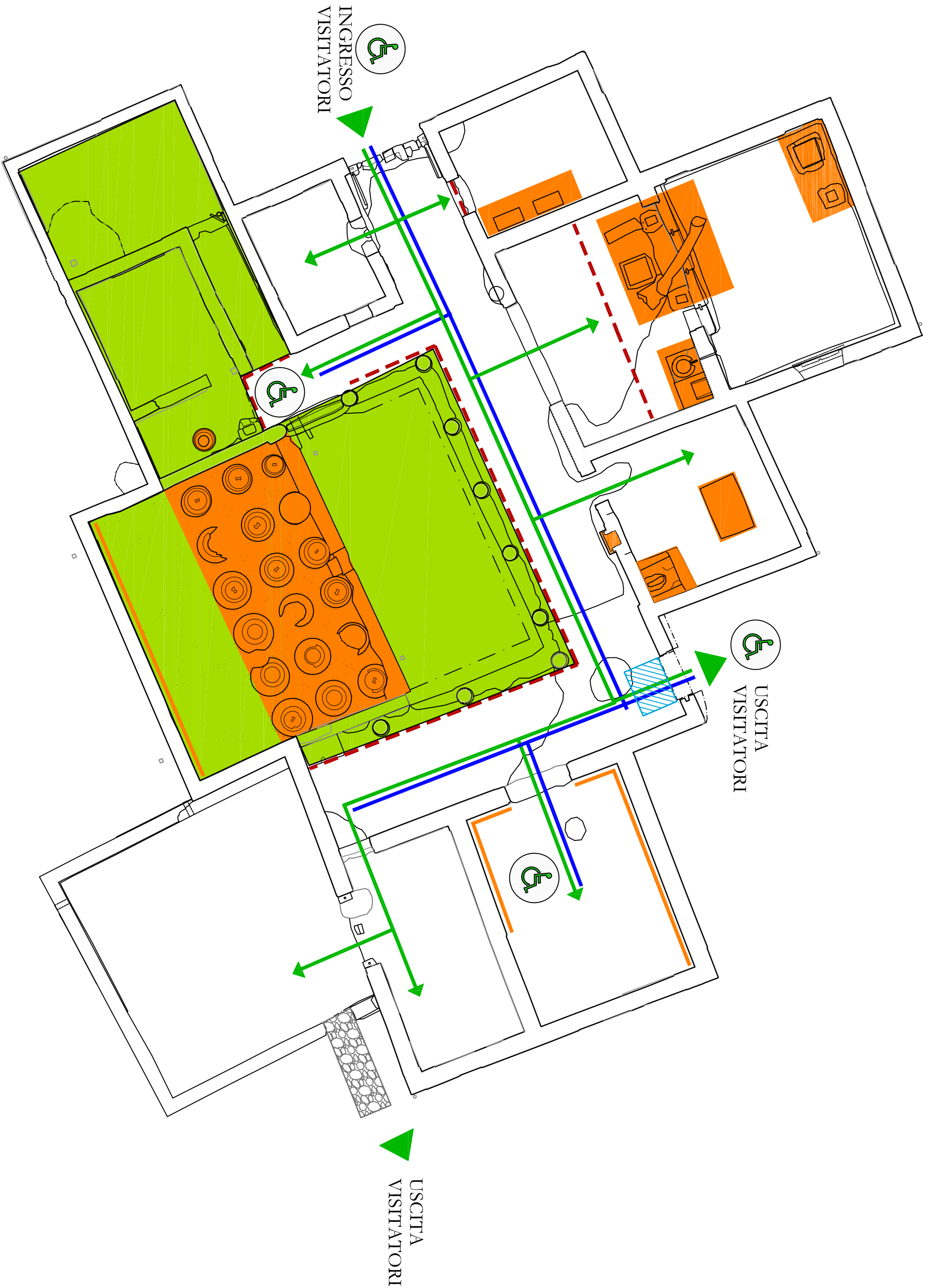
PIANTA PIANO TERRA INTERVENTI VOLTI ALLA VALORIZZAZIONE E ALL'ACCESSIBILITA'